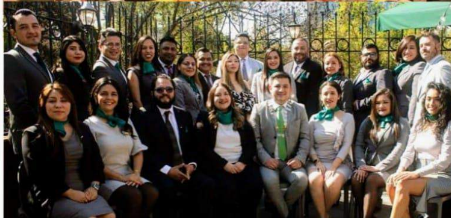
Sen. Joaquín Martínez Yannini Tesorero Nacional, en representación del Senado JCI México, en la Reunión de Funcionarios Nacionales y Presidentes Locales JCI México. Ciudad de México, 7 de Enero de 2023.