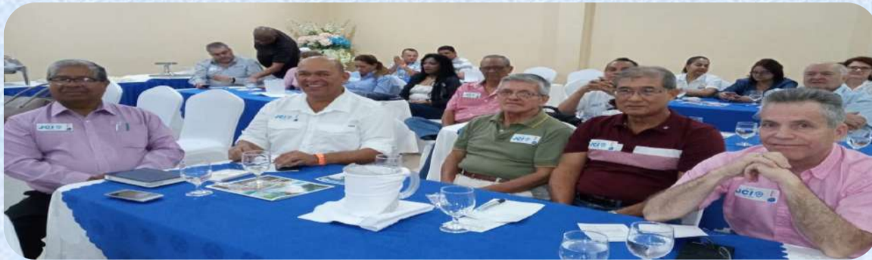
Visit of the Vice President of ASAC to the national convention of Panama