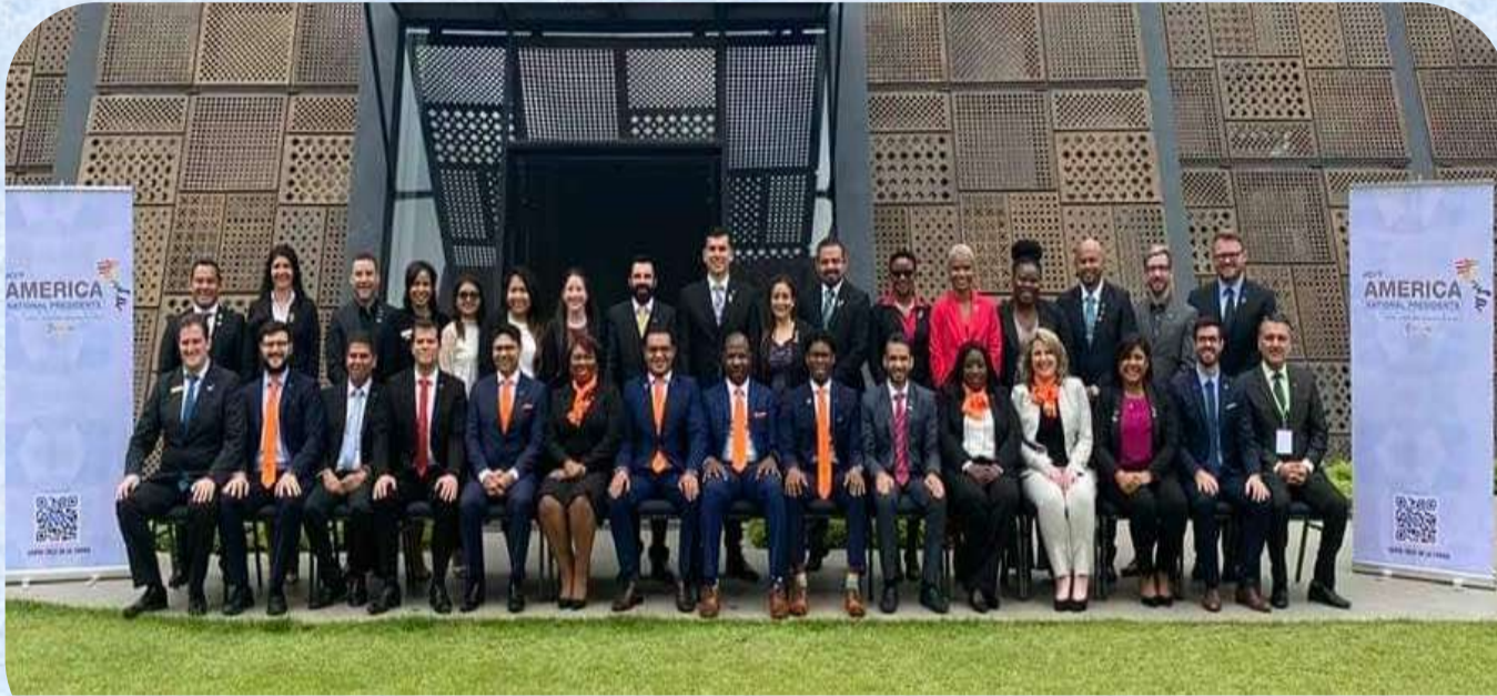
Foto oficial de la Reunión de Presidentes Nacionales de las Américas Apoyo del Senado en la noche boliviana