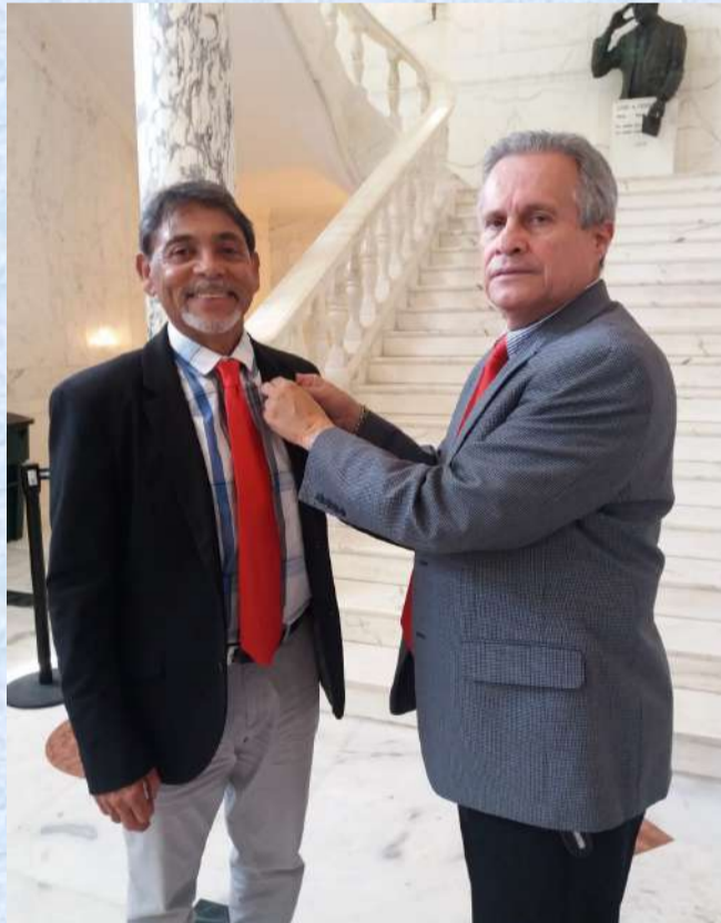
Nueva junta directiva Puerto Rico