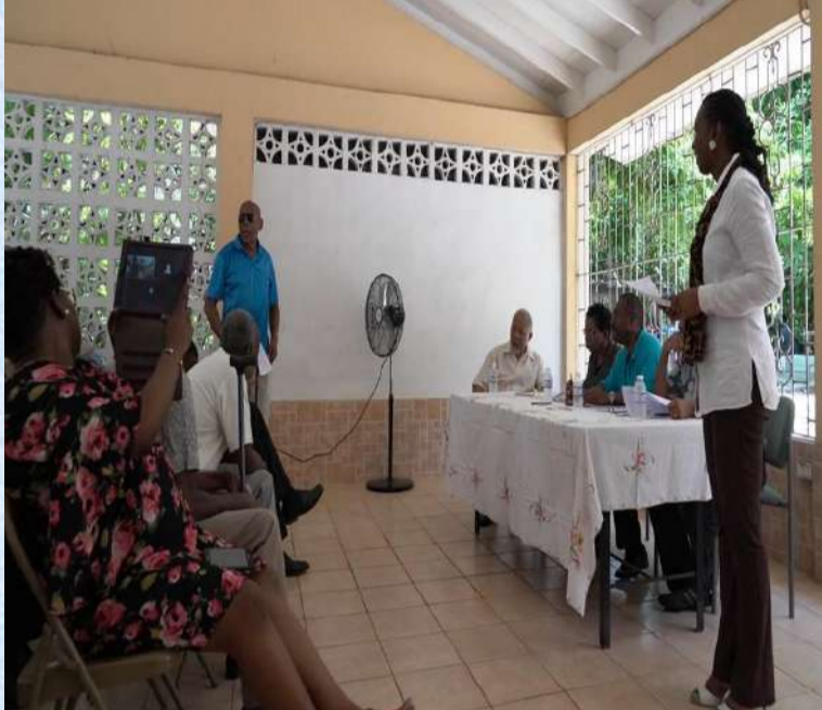
Reunión del Senado de Jamaica/ Senators meeting of the Senate of Jamaica

Convención Nacional de JCI Ja- maica. Cuatro senadurías fueron entregados: National Convention JCI Jamaica . Four senators were awarded: