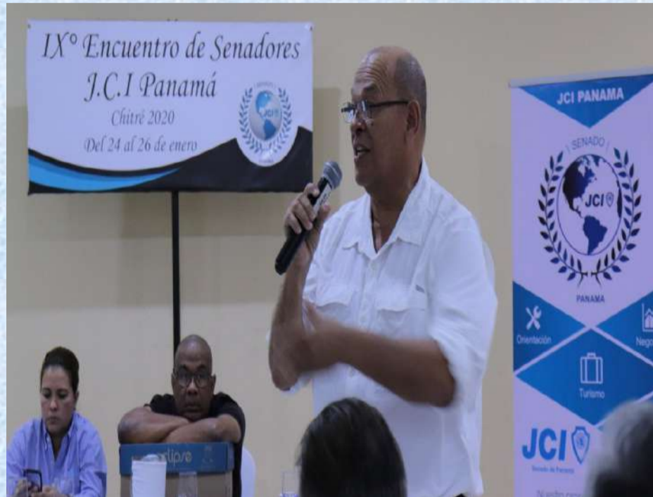
Visita del Vice presidente a la convención nacional de Panamá