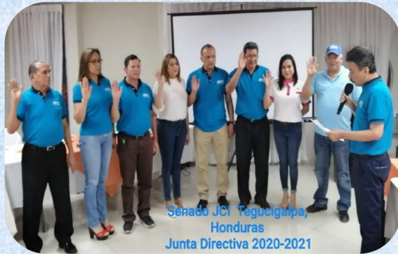
Senado JCI Tegucigalpa, Honduras Junta Directiva 2020-2021