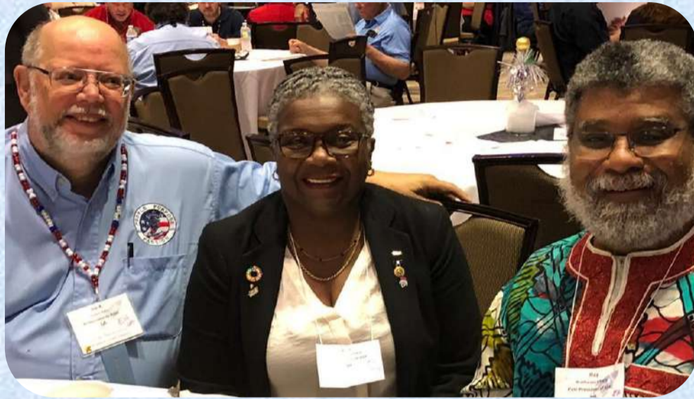
ASAC Visitando al Senado de USA en Melbourne Florida