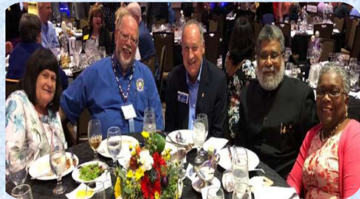
ASAC Moment at US JCI Senate Winter Board Meeting 2020 in Melbourne Florida