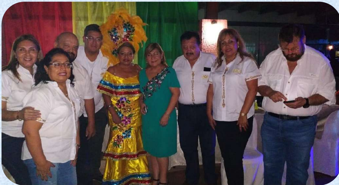
Official photo of the Meeting of National Presidents of the Americas Senate support on Bolivian night