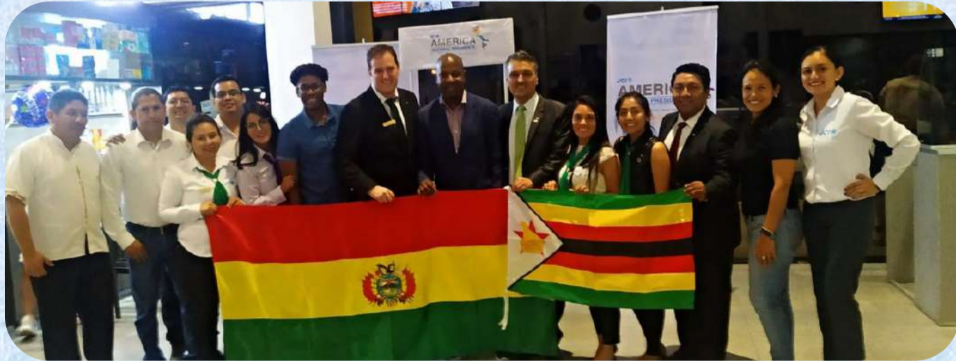
Llegada del Presidente Mundial a la Reunión de Presidentes Nacionales de América 2020